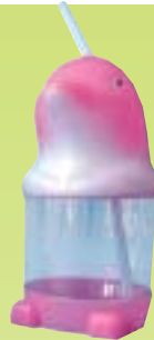
JB.06 Le Dauphin.