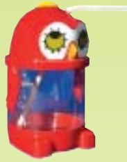
JB.13 La Chouette.