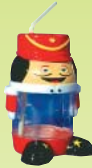
JB.30 Le Militaire.