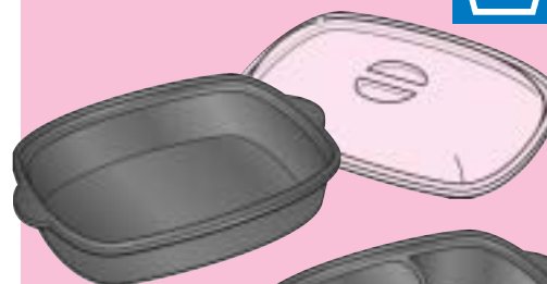
BBP.1000 1 Kg.