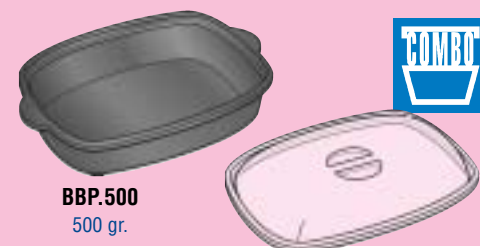
BBP.500 500 gr.