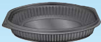
BBP.70 35 cl. - h. 25 mm.