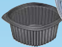
BBN.51 60 cl. - h. 60 mm.