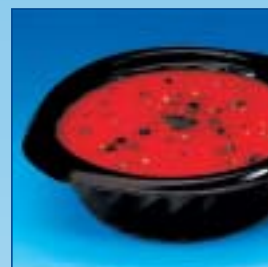
BBP.50 500 cc. ø 163 x h. 60 mm.