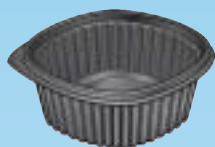
BBN.50 40 cl. - h. 45 mm.