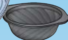
BBP.35 350 cc. ø 142 x h. 48 mm.