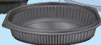
BBP.71 50 cl. - h. 40 mm.

Toutes ces cassolettes passent au four à micro-ondes.