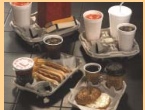
PG: Plateaux porte-gobelets en page 123.