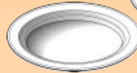
AK.254 AK.260 ø 254 mm. ø 260 mm.