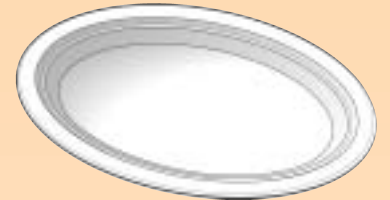
AK.925 250/310 mm.