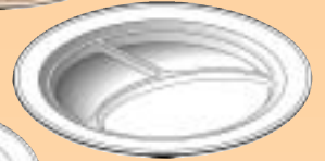
AK.255 AK.263 ø 254 mm. ø 260 mm.