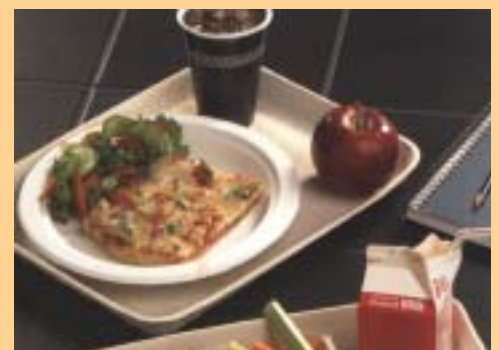
PKT: Plateaux de dépannage en page 122