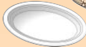
AK.919 190/250 mm.